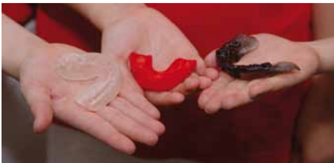
Individueller Sportmundschutz – kultverdächtig!

Klassiker wie Hockey, Kampfsport und Reiten oder auch Trendsportarten wie Inline-Skating, Skate-Boarding und Mountainbiking bergen ein hohes Risiko für