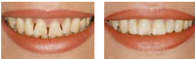
Gelungenes Beispiel: links ohne, rechts mit Veneer-Versorgung.

Innovative Dental-Keramiken kombiniert mit der sogenannten „Adhäsiv-Technik“ (Klebertechnik) machen heute neue ästhetische Rekonstruktionen von Zähnen im sichtbaren Bereich möglich. Statt einer Krone werden oftmals Keramikschalen (Veneers) eingesetzt, die eine Schichtstärke unter einem Millimeter aufweisen. Ein geschädigter Zahn wird so substanzschonend verschönert. Dabei hängt es vom Zerstörungsgrad des Zahnes ab, wie sehr dieser beschliffen werden muss. Ein Veneer