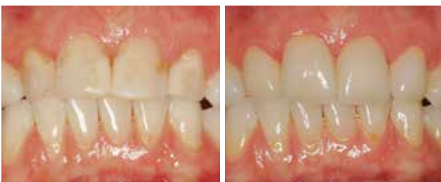
Die verfärbten Frontzähne mit auffälligen älteren Füllungen und Ab-radiierungen an den Schneidekanten wurden neu aufgebaut. – Es ergibt sich wieder eine durchgehend schöne Zahnreihe.

Was für die Zähne gilt, betrifft natürlich auch das Zahnfleisch. Entzündungen, Verfärbungen und freiliegende Zahnhälse beeinträchtigen das harmonische Zusammenwirken von Lippen, Zähnen und Zahnfleisch. Auch hier kann der Zahnarzt einiges tun – dank vielfältiger Behandlungsmethoden in der Parodontologie.