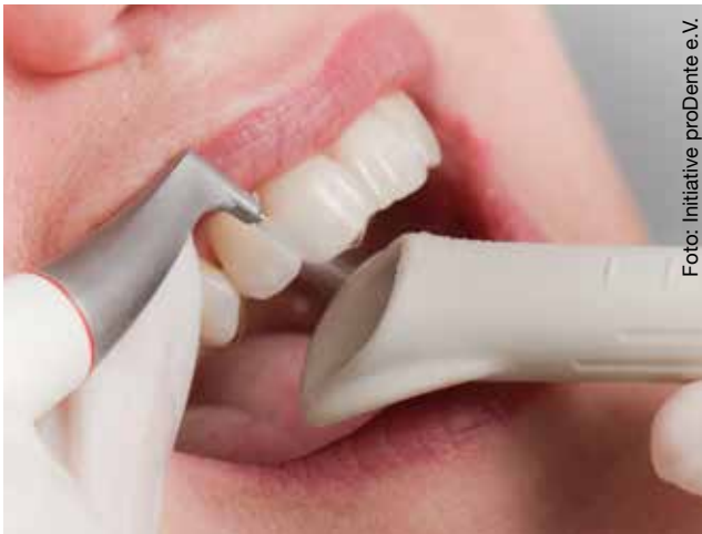
Mit dem Pulverstrahlgerät lassen sich die Zahnzwischenräume reinigen.

Die regelmäßige Prophylaxe ist die Voraussetzung für eine auch langfristig erfolgreiche Behandlung. Bei der PZR geht es auch darum, die heimische Zahnpflege zu überprüfen und zu verbessern. Das alles übernimmt eine speziell ausgebildete Prophylaxehelferin oder Dentalhygienikerin in der Zahnarztpraxis.