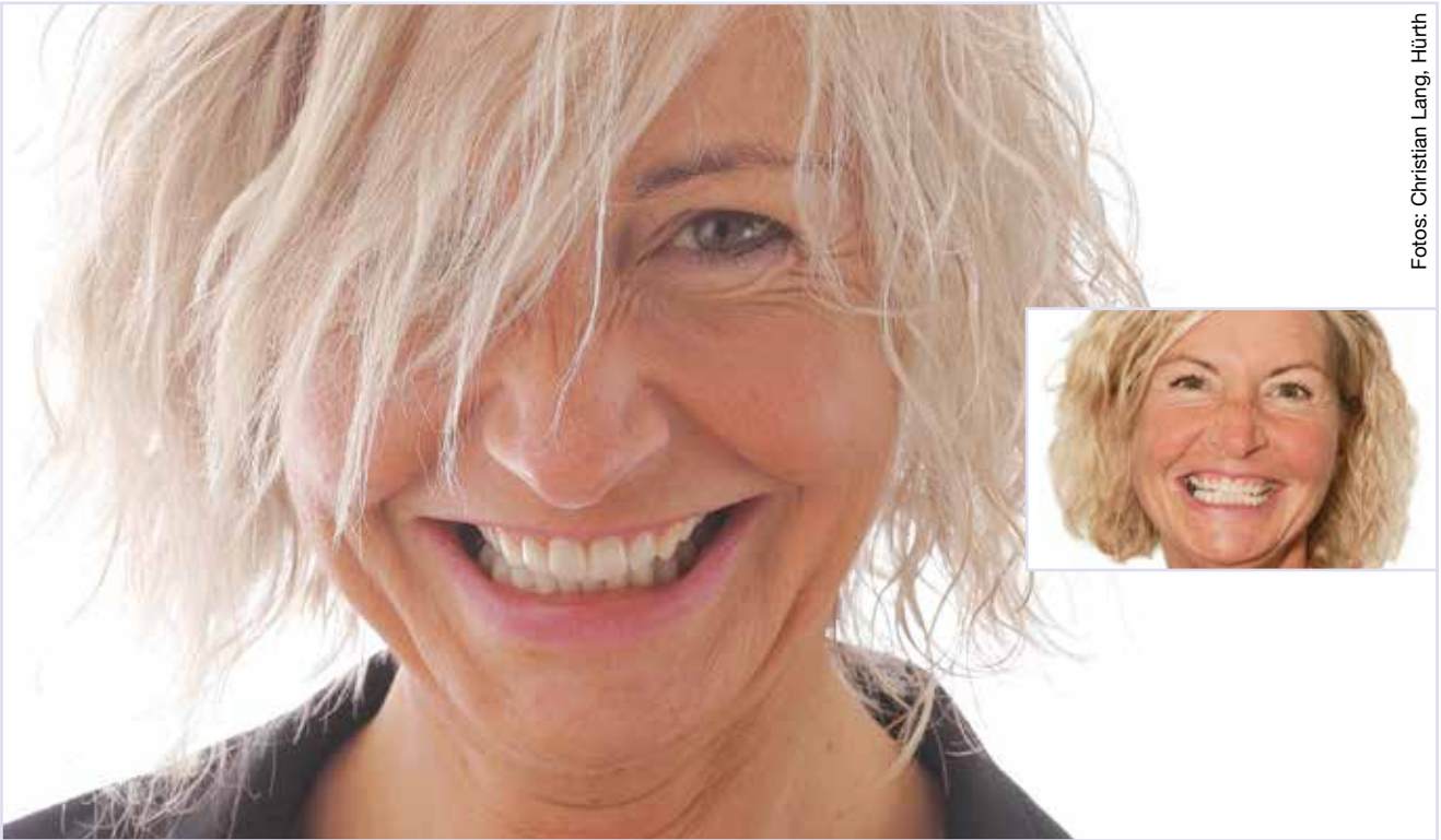
Ein strahlendes, sympathisches Lächeln - die moderne ästhetische Zahnheilkunde macht es möglich.

Verfärbungen, leichte Fehlstellungen und Beschädigungen, aber auch Lücken oder zu kurze Zähne heute substanzschonend korrigieren.