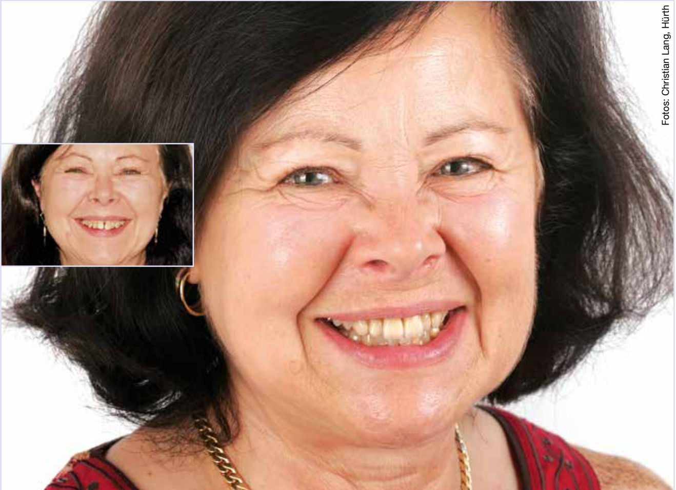
Die Zahnreihe ist geschlossen, die Zähne wirken insgesamt heller und frischer.